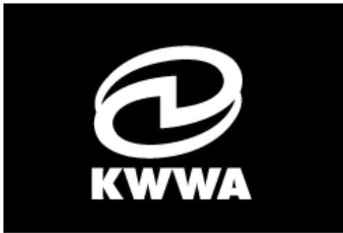
-Black 배경 적용시 White로 사용가능